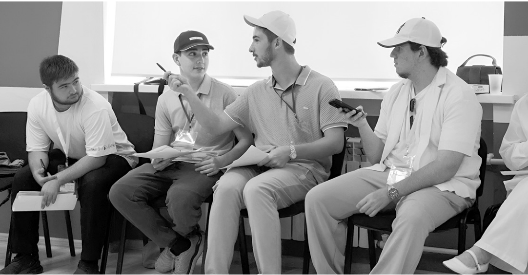
Участники клуба освоили живой разговорный английский язык