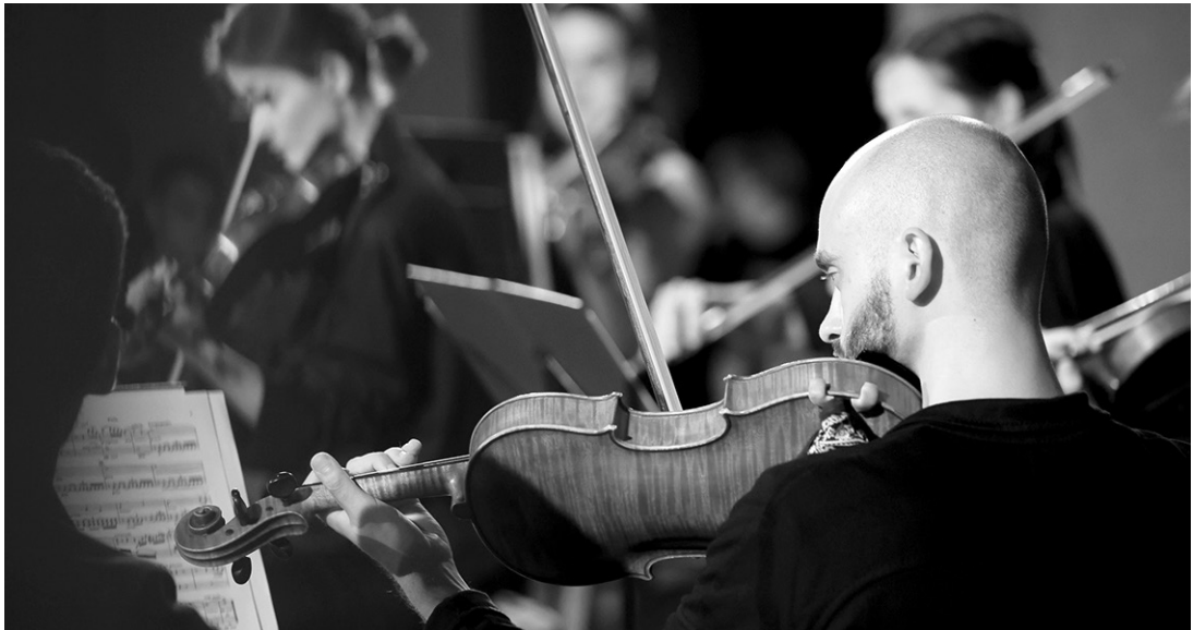
Выступление скрипача покорило зрителей

Безусловно, музыка была главной на этом фестивале. Конечно, все прошедшие концерты не описать. В числе самых запоминающихся — концерт «Арии любви.