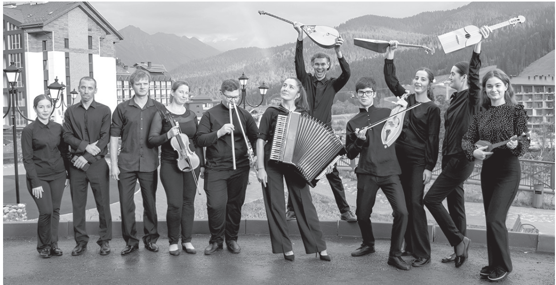
Участники фестиваля музыки и науки «Выше звука»