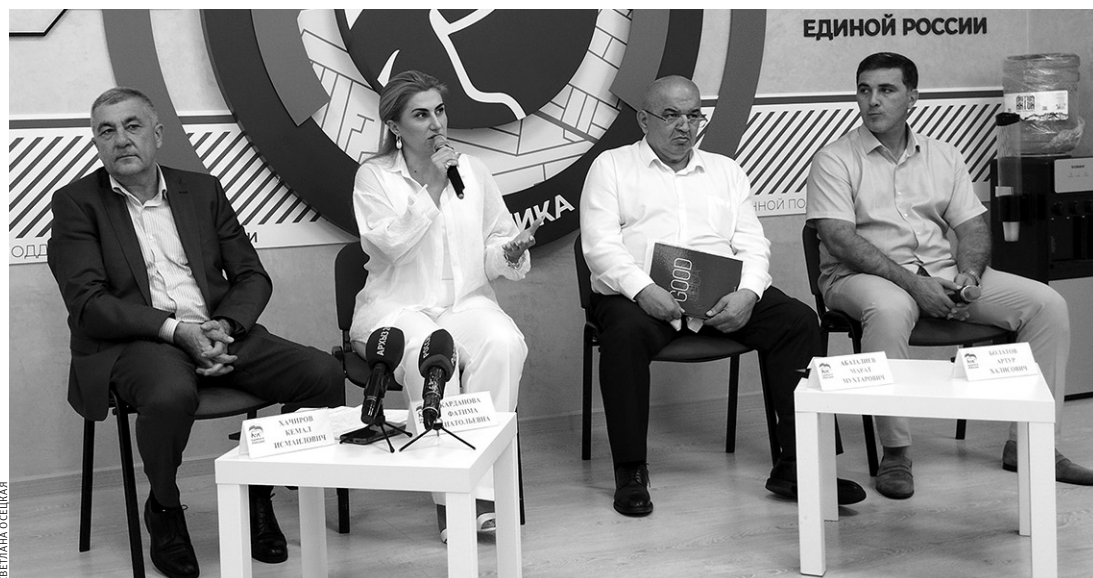
Участники встречи рассказали о том, какая помощь оказывается ветеранам и их семьям

Сегодня запущен кадровый проект «Герои Отечества», который создан специально под участников СВО. Кроме того, в «Единой России» совместно с управлением занятости проводится работа, чтобы члены семей участников СВО смогли либо пройти пере- обучение, либо получить образование для своего трудоу- строения.