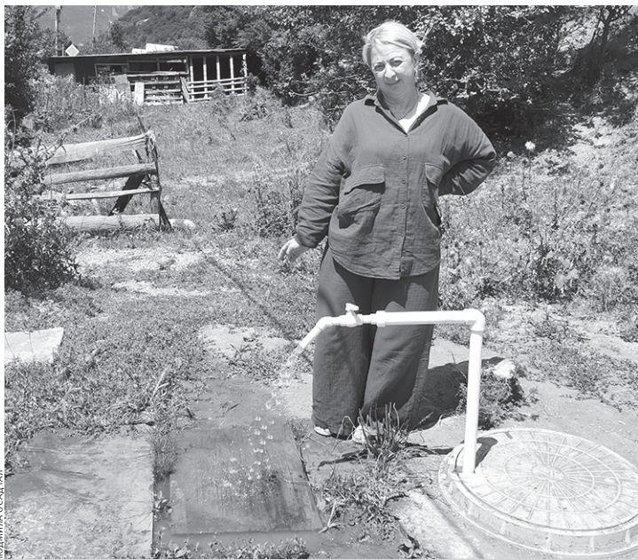
Родниковая вода из водопровода в микрорайоне Маркопи

Вот и на улице Горной, которая оправдывает своё название и находится на 70–90 метров выше центра посёлка, централизованное водоснабжение отсутствовало, и единственным источником был родник, из которого протянута труба в большой резервуар — накопитель (каптаж). Из него вода поступает во дворы жителей улицы Горной. Понятное дело, ни на полив огородов, ни на